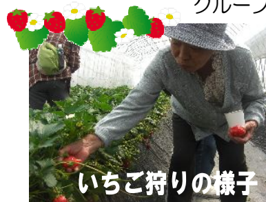
いちご狩りの様子