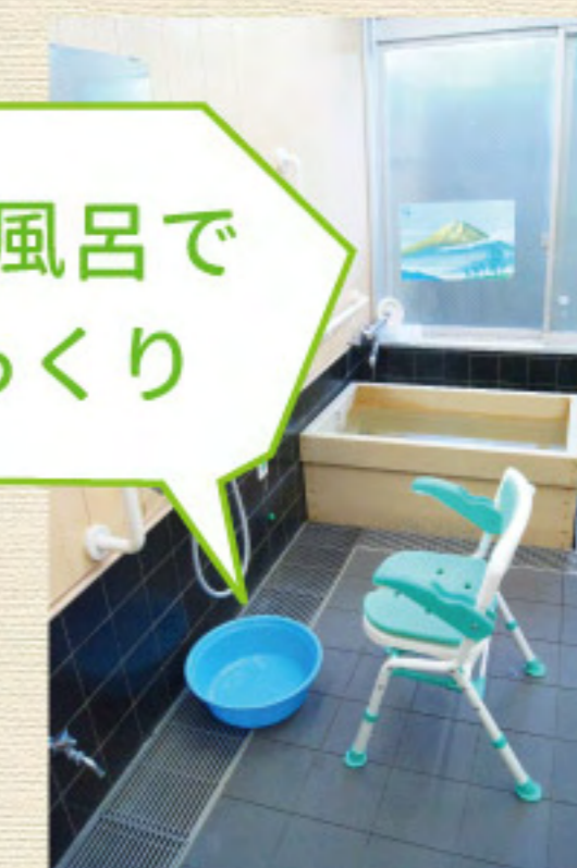
ひのき風呂で ごゆっくり