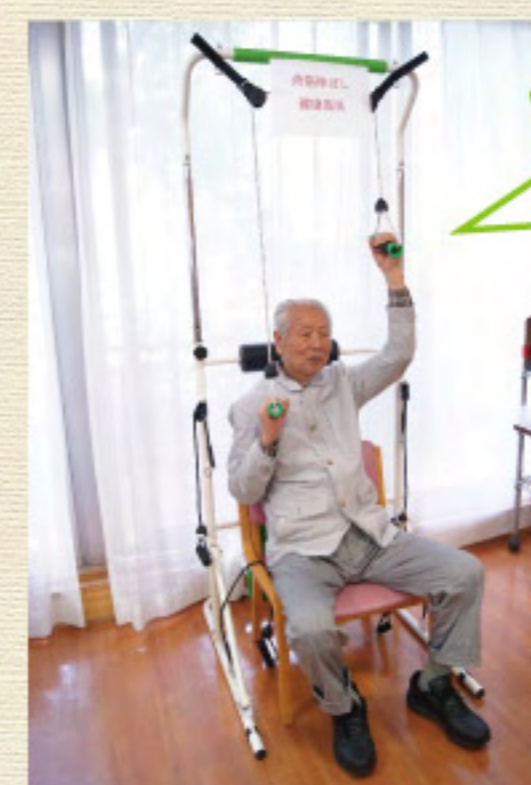
肩甲骨の稼動域を ひろげて