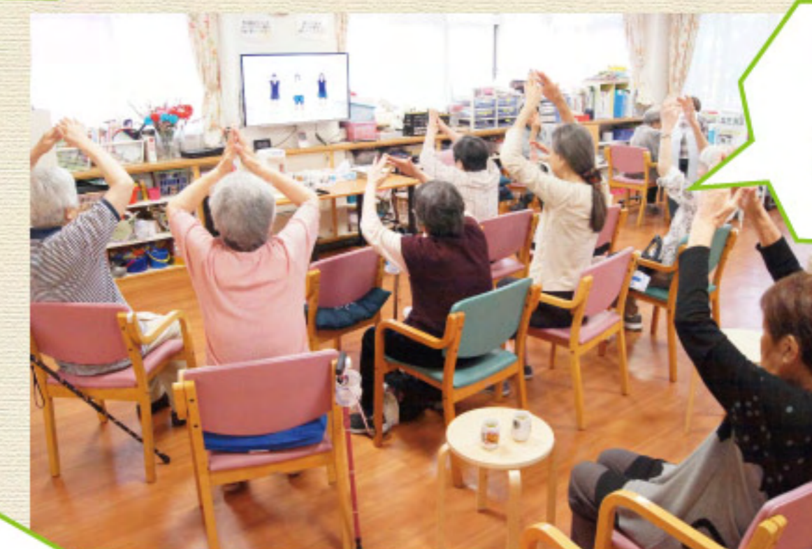
朝からしっかり 身体を動かします