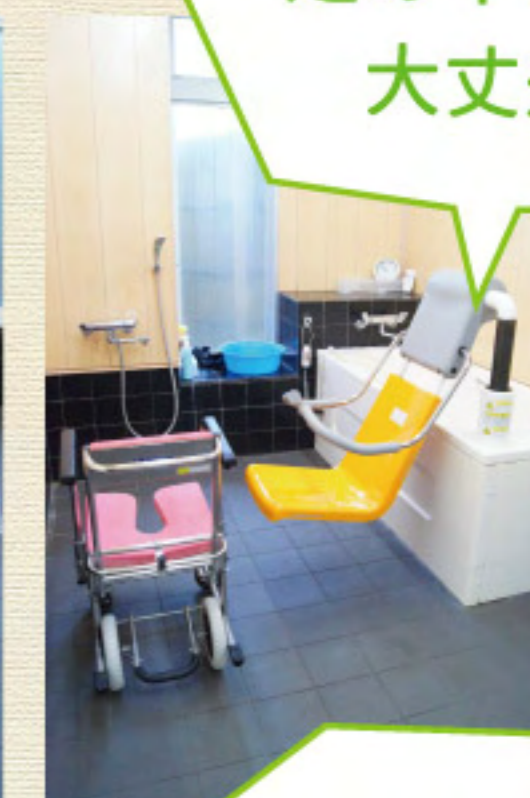
足の不自由な方も 大丈夫です！