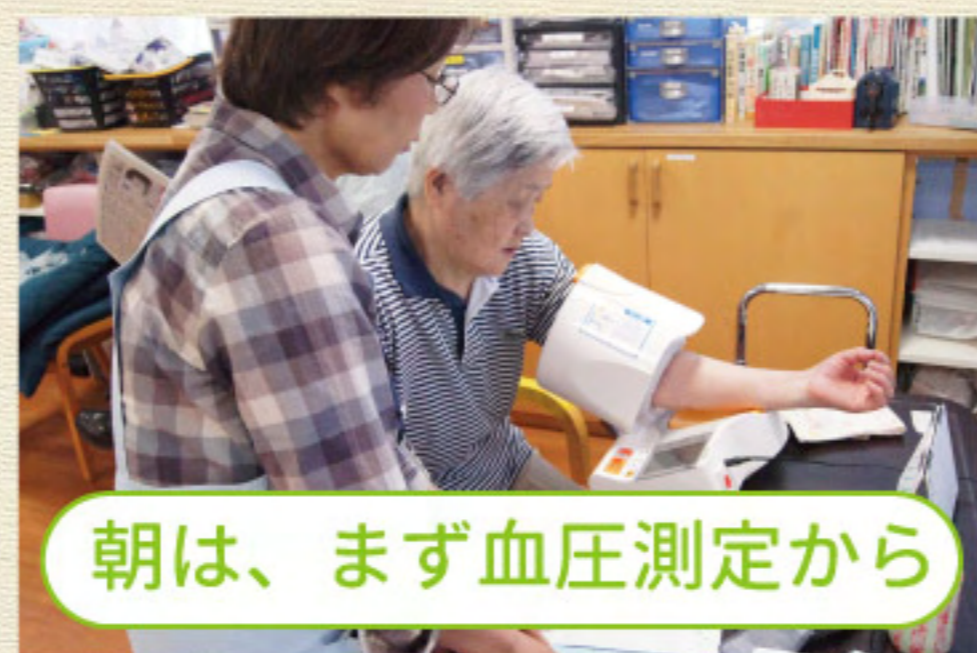
朝は、まず血圧測定から