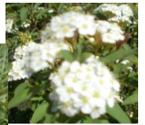
散歩道の花々 つつじ たんぽぽ こでまり 躑躅 蒲公英 小手鞠