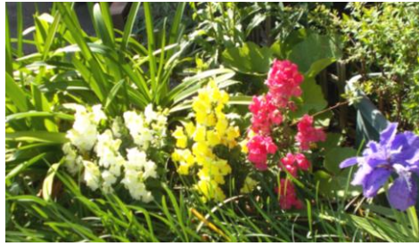
掃除に行ってる児童遊園の花壇 3色の「金魚草」と「一初」の花