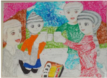
4月カレンダー:桜の下でカンパ〜イ