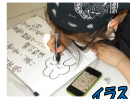
イラストの得意なスウ職員