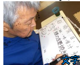
文字のきれいなTさん